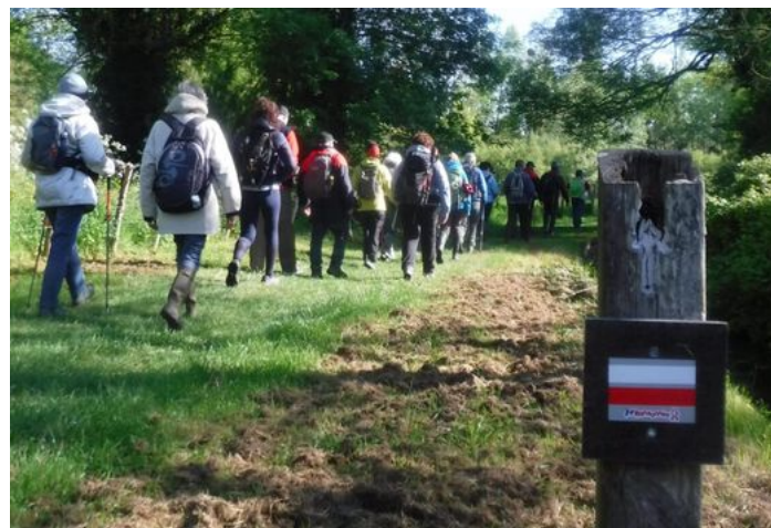
Passage obligé le long du Charenton (c'est humide!)

Leçon du jour : au croisement de plusieurs GR®, soyez attentif au numéro du GR® qui est indiqué sur les balises ou les panneaux.