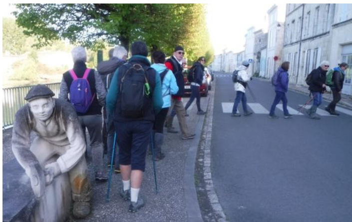
Départ pour tous de l'île de la Grenouillette

Une journée de randonnée belle et mouvementée avec son lot d'anecdotes!