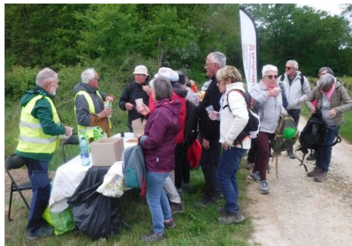
Ravitaillement à l'entrée de Juicq